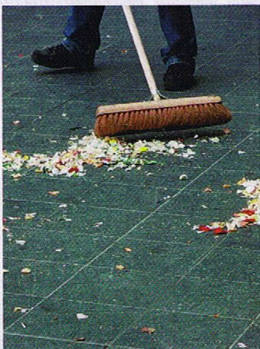
Slecht management, meer troep

Hilarisch is het verhaal van de vier veegploegen in een grote stad. Het management van de reinigingsdienst had TNO Arbeid gevraagd een oplossing te zoeken voor het hoge ziekteverzuim van de vegende mannen. Zelf kwam de leiding daar niet uit. Regelmatig gebeurde het dat een veegploeg niet kon uitrukken doordat één of twee mannen verstek lieten gaan. Dit leidde ertoe dat een volgende veegploeg extra hard